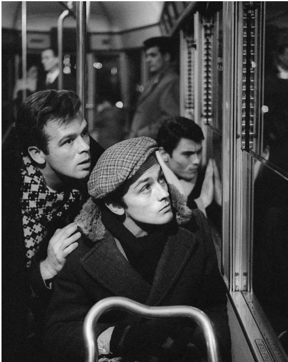
Rocco e i suoi fratelli di Luchino Visconti, 1960 - Renato Salvatori, Alain Delon e Max Cartier