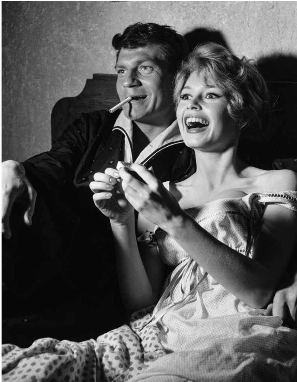
Une parisienne (Una parigina) di Michel Boisrond, 1957 - Henri Vidal e Brigitte Bardot